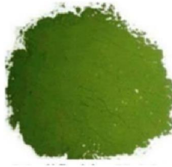
Gambar 4. Tepung Spirulina platensis