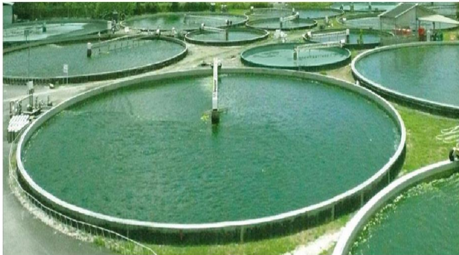
Gambar 5. Produksi mikroalga Chlorella vulgaris dan Spirulina platensis dengan sistem kolam terbuka

Australia, Amerika Serikat, Jepang, Inggris, India, Selandia Baru dan Kanada adalah beberapa contoh produsen utama Spirulina platensis di dunia (Al-Dhabi 2013). Seperti halnya Chlorella vulgaris , Spirulina platensis juga umumnya diproduksi pada kolam terbuka dan bioreaktor tertutup ( closed photobioreactors ) (Vonshak & Richmond 1988; Shams et al. 2017; El-Sayed & El-Sheekh 2018). Secara umum, mikroalga termasuk Spirulina platensis membutuhkan air, CO 2 dan cahaya matahari untuk dapat hidup dan berkembang (Shams et al. 2017). Oleh karena itu kontrol dan pemenuhan terhadap komponen-komponen tersebut mutlak diperlukan untuk menghasilkan produk Spirulina platensis yang memiliki nilai nutrisi dan fungsional (senyawa bioaktif) yang tinggi.