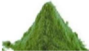
Gambar 2. Tepung Chlorella vulgaris