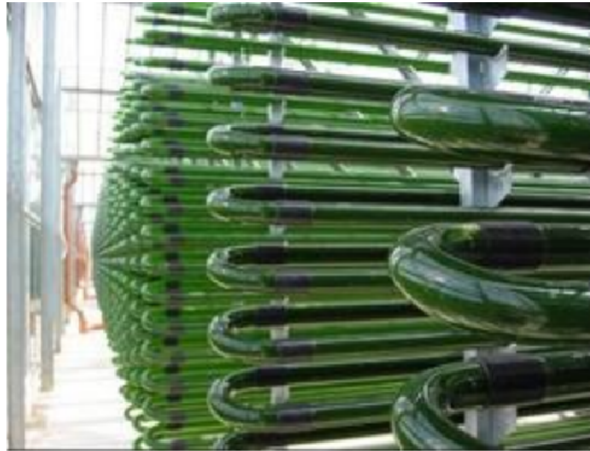
Gambar 6. Produksi mikroalga Chlorella vulgaris dan Spirulina platensis dengan bioreaktor tertutup