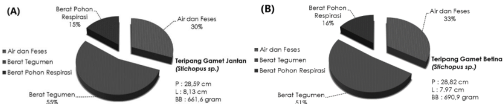
Gambar 3. Karakter Morfometri Teripang Gamet (A : Jantan, B : Betina)

Teripang kedua yang dijadikan obyek penelitian adalah jenis Teripang Gamet ( Stichopus sp.), dimana teripang ini merupakan komoditas unggulan dari Pulau Nyamuk, Karimunjawa (Musyafak, Komunikasi Pribadi 2020). Teripang Gamet mempunyai panjang maksimal mencapai 28,59-28,82 cm, lebar maksimal mencapai 7,97-8,13 cm, dengan berat maksimal mencapai 690,93 gram. Jenis teripang Gamet mempunyai ukuran mencapai 28,6 cm menurut Sulardiono (2011) di Kecamatan Karimunjawa. Hal tersebut menandakan bahwa teripang di Pulau Nyamuk dan Karimunjawa mempunyai kemiripan panjang. Sedangkan parameter lain seperti lebar dan berat belum bisa dibandingkan, karenan minimnya penelitian yang dilakukan serta data yang tidak selalu ada (Kohler et al. 2009). Teripang Gamet di temukan pada kedalaman 5-25 meter, hal tersebut sesuai dengan referensi Yusro (2001) bahwa teripang jenis ini ditemukan di perairan berkisar 5-15 m. Teripang Gamet tidak termasuk jenis teripang yang mempunyai Cuvierian Tubules , hal ini ditandai dengan tidak ditemukannya jaring putih khas dan lengket yang biasanya dimiliki oleh teripang yang mempunyai Cuvierian Tubules .