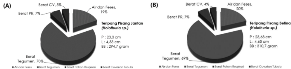
Gambar 2. Karakter Morfometri Teripang Pisang (A : Jantan, B : Betina)