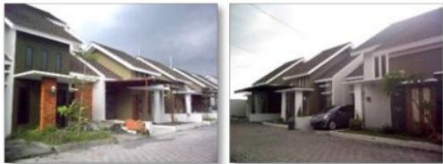
Gambar : Perumahan Peni Regency