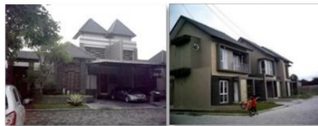
Gambar : Perumahan Tirta Maya Residence Sumber : Dokumentasi Pribadi