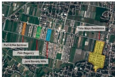
Gambar : Peta Orientasi Kedekatan Antar Perumahan