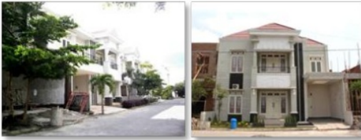
Gambar : Puri Artha Sentosa