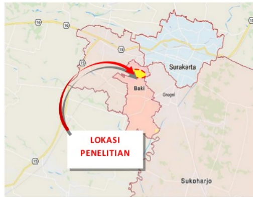
Gambar : Lokasi Penelitian Di Baki, Sukoharjo

13 Obyek penelitian terletak di Kelurahan Gentan, Kecamatan Baki, Kabupaten Sukoharjo. Terdapat empat Perumahan yang dipilih sebagai obyek penelitian, yang semuanya dapat diakses dari Jalan Mangesti Raya