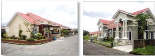
Gambar : Perumahan Java Beverly Hills