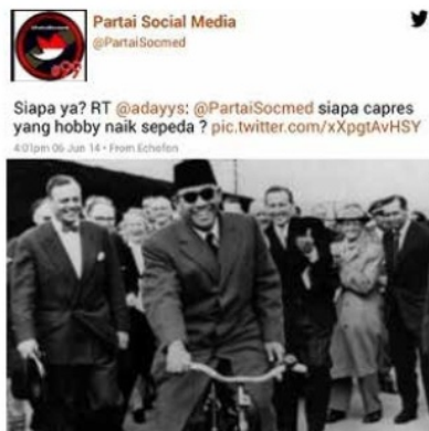
Gambar 3. Eksploitasi Sosok Soekarno sebagai alat legitimasi.

Islam dengan PKI yang terjadi hingga masa kemerdekaan. Temuan teks penelitian ini, Islam selalu direpresentasikan berseberangan dengan PKI. Pada awal 1920-an bersamaan dengan mudarnya peran SI yang mewadahi kedua kelompok tersebut, muncullah paham baru yang disebut ideologi kebangsaan (nasionalis) yang dibawa Partai Nasional Indonesia (PNI). Bagi Soekarno paham ini merupakan pilihan terbaik “baik demi kemerdekaan maupun demi masa depan rakyat Indonesia yang Kristen maupun Muslim” (Kahin, 1952: 90).