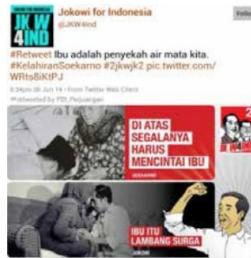
Gambar 3. Representasi Jokowi yang digambarkan sebagai sosok yang berbakti kepada ibu.

Dalam konteks pilpres 2014, nasionalisme dieksploitasi sebagai alat legitimasi capres ideal namun hanya menggunakan sosok Soekarno sebagai pencetusnya. Meski sama-sama mengeksploitasi sosok Soekarno namun keduanya menggunakan pola yang berbeda. Jokowi lebih berfokus pada upaya menggunakan gagasan-gagasan Soekarno, sementara Prabowo lebih berfokus pada penggunaan simbol-simbol fisik Soekarno seperti peci, baju bersaku dua dan cara berpidato. Gagasan Soekarno yang dipakai