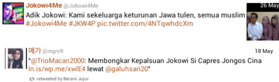
Gambar 2. Twit dari akun pro Jokowi dan pro Prabowo

seperti Twit ke dua yang dibuat Twitter pro Prabowo @TrioMacan2000.