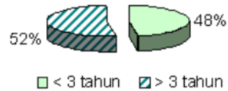
Gambar 1. Distribusi Frekuensi Masa Kerja Subjek Penelitian di Industri Sale Pisang Suka Senang Kabupaten Ciamis Tahun 2007

Berdasarkan gambar 1 diketahui bahwa sebanyak 52% subjek penelitian (11 orang) telah bekerja selama lebih dari 3 tahun, sedangkan subjek penelitian dengan masa kerja kurang dari tiga tahun sebanyak 48% (10 orang).