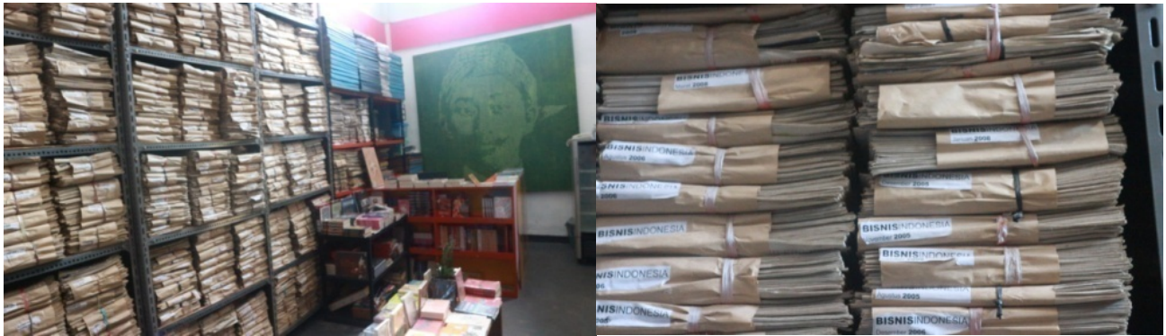
Gambar 1. Arsip Koran di Radio Boekoe