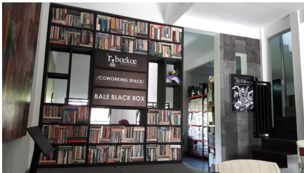
Gambar 4. Co-working Space Bale Black Box di Radio Boekoe