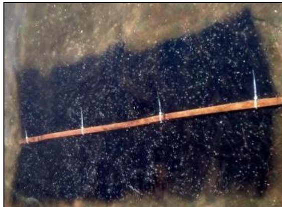
Gambar 3. Kakaban yang telah dipenuhi telur ikan koi ( Cyprinus carpio )