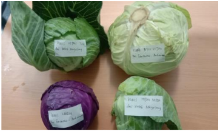
Gambar 1: Empat Macam Sampel Kubis yang akan dilakukan Uji Determinasi