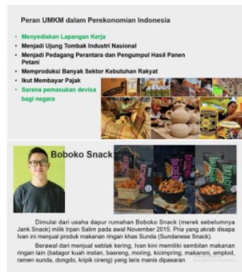
Gambar 1. Materi Sesi 1