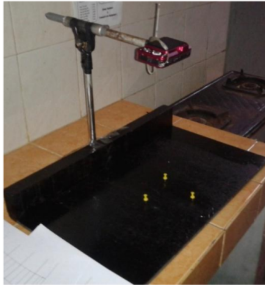
Gambar 1. Papan pengambilan data.