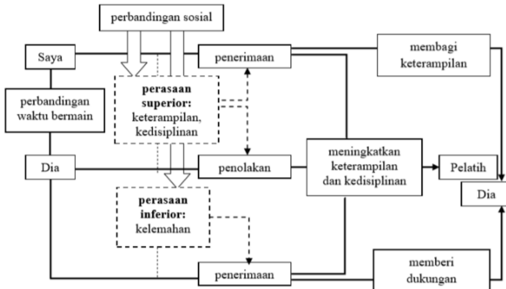
Gambar 5.3. Relasi Ataranggota Intragroup

keterampilan mempertegas bahwa relasi cenderung bersifat membangun. Relasi dimaknai sebagai jalan untuk meningkatkan keterampilan sebagai pemain sesuai minat.