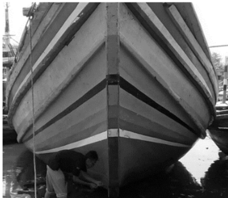
Gambar 3. Pengambilan data ketebalan biofouling pada lambung kapal ikan

Tujuan dari survey ini adalah untuk mendapatkan besarnya ketebalan biofouling yang menempel sepanjang badan kapal untuk kapal yang Wilayah Pengelolaan Perikanan (WPP) 573. Nelayan yang ada di wilayah perairan Jember memiliki WPP dengan kode 573 yaitu Samudera Hindia Selatan Jawa hingga Laut Timor bagian Barat. Wilayah ini memiliki total potensi hasil laut sebesar 929.330 ton/tahun dengan jenis dan hasil paling banyak adalah ikan pelagis besar (tuna dan cakalang). Nilai ini adalah 9,357% dari jumlah nasional (KKP, 2017). Adapun bagian dan hasil surveynya ditampilkan pada Tabel 2.