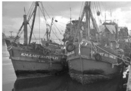
Gambar 1. Lambung kapal ikan dipenuhi biofouling

Gambar 1 adalah lambung kapal ikan yang dipenuhi dengan biofouling . Munculnya biofouling mengakibatkan penurunan kecepatan dan maneuver daya jelajah kapal. Laju kapal yang semakin berat otomatis mengakibatkan peningkatan bahan bakar yang dibutuhkan kapal. Pemakaian bahan bakar pada kapal yang berlayar di perairan beriklim sedang selama 6 bulan akan meningkat sebesar 35%-50% (Redfield, 1952).