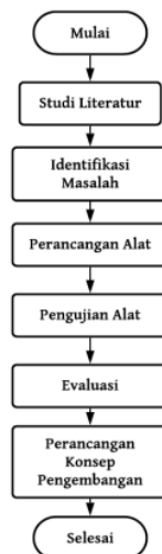
Gambar 1. Diagram alir penyelesaian masalah

Pada analisis ini dibuat diagram alir penyelesaian masalah yang menggambarkan bagaimana pemecahan masalah dari awal sampai akhir berdasarkan hasil dari analisis keseluruhan penelitian. Berikut merupakan diagram alir penyelesaian masalah pada Gambar 1