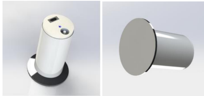
Gambar 2. Desain CAD wireless stethoscope