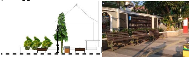
Gambar 5. Elemen Tempat Duduk

Keberadaan tempat duduk dengan desain klasik dapat memberikan kesan yang unik dan dapat memperkuat karakter visual koridor Jalan Diponegoro sebagai kawasan bersejarah peninggalan Kolonial Belanda.