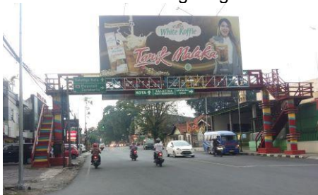
Gambar 9. Elemen Jalur Penyeberangan

Sardon (1986) berpendapat bahwa dominasi merupakan satu atau dua elemen yang terlihat sangat mendominasi dari lingkungan sekitarnya.