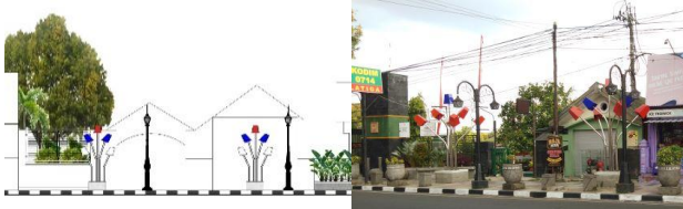
Gambar 4. Kekontrasan Lampu Penerangan Desain Modern dengan Desain Klasik

Selain itu, meskipun lampu penerangan dengan desain klasik lebih mendominasi, keberadaan lampu penerangan dengan desain modern yang diletakkan bersamaan dengan lampu penerangan desain klasik pada beberapa tempat memberikan indikasi adanya percampuran langgam pada perabot jalan khususnya lampu penerangan. Selain langgam, perbedaan warna antara lampu penerangan dengan desain klasik dan modern memberikan adanya perbedaan yang kontras yang berpengaruh terhadap persepsi visualnya. Hal ini sejalan dengan Ching (2008) yang menyebutkan bahwa warna merupakan atribut terjelas dalam memberikan sebuah bentuk dari lingkungannya dan juga mempengaruhi beban visualnya. Beberapa temuan diatas memberikan indikasi bahwa dampak yang dapat ditimbulkan dari adanya langgam dan penggunaan warna pada lampu penerangan dapat melemahkan karakter visual dari koridor Jalan Diponegoro yang dikenal sebagai kawasan peninggalan Kolonial Belanda.