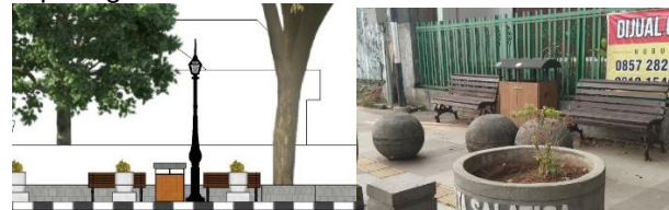
Gambar 6. Elemen Tempat Sampah

Sardon (1986) menyebutkan bahwa sifat monoton merupakan sifat kesamaan yang ada melalui satu atau dua elemen. Pada elemen tempat sampah, sifat monoton dapat dilihat melalui elemen warna yang didominasi oleh warna gelap. Selain itu, adanya kepadatan yang terlihat terpadu dengan elemen lampu penerangan dan tempat duduk sehingga dapat memberikan pengaruh terhadap terbentuknya karakter visual koridor Jalan Diponegoro