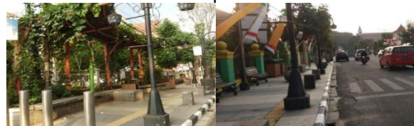
Gambar 2. Dominasi Elemen Trotoar dengan Dimensi >2 Meter pada Sisi Utara dan Sisi Selatan Koridor

yaitu dengan panjang kurang lebih 1000 meter pada sisi utara dan 1000 meter pada sisi selatan.