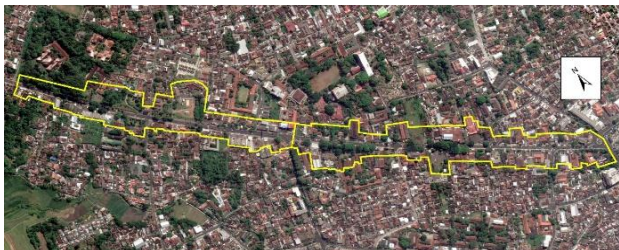
Gambar 1. Lokasi Penelitian pada Koridor Jalan Diponegoro

Koridor Jalan Diponegoro terletak mulai dari Kantor Kementerian Agama Kota Salatiga yang berbatasan dengan Jalan Blontongan sampai dengan bundaran Patung Garuda Tamansari, persimpangan dengan Jalan Jendral Sudirman, Jalan Patimura dan Jalan Kalitaman. Namun dalam penelitian ini tidak semua koridor Jalan Diponegoro akan dibahas, dimana hanya dilakukan pengamatan mulai dari persimpangan Jalan Jambewangi sampai dengan Patung Garuda Tamansari dengan panjang kurang lebih 1.900 meter dengan karakteristik jalan yang lurus dan cenderung datar. Pembatasan lokasi penelitian ini didasari oleh keberadaan elemen-elemen trotoar yang dominan, keberagaman aktivitas dan fungsi bangunannya, serta pertemuan penggal jalan. Lokasi penelitian ini kemudian dibahas pada kedua sisi koridornya yaitu sisi utara dan sisi selatan.