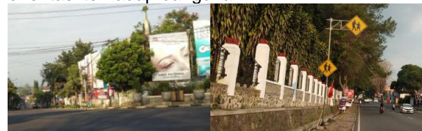
Gambar 7. Elemen Signage

Signage yang terdapat pada zona jalur pedestrian umumnya sama seperti jalan-jalan yang ditemukan di kota lain sehingga tidak cukup menggambarkan kesan visual yang dapat mempengaruhi karakter visual koridor Jalan Diponegoro Salatiga. Meskipun demikian, penempatan signage dengan skala yang cukup besar pada beberapa titik terlihat menutupi fasad bangunan sehingga dapat mengurangi orientasi terhadap bangunan.