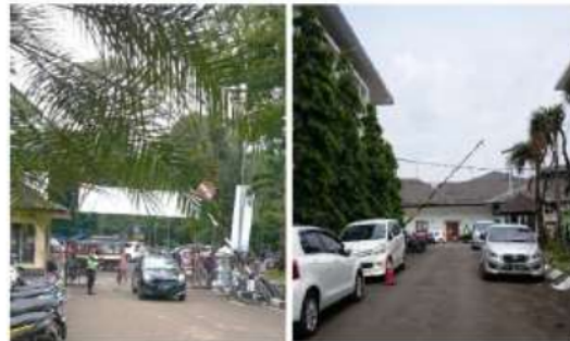
Gambar 1. Situasi parkir

Parkir mobil yang terletak di sebelah Barat museum ini sama sekali belum menyediakan parkir khusus difabel maupun passenger loading zone. Jalan akses pada museum ini juga digunakan sebagai area parkir mobil paralel, sehingga ketika ada dua mobil yang berlawanan arah maka salah satu mobil harus mengantre terlebih dahulu untuk lewat. Hanya terdapat satu area parkir yang dilengkapi dengan garis penanda batas parkir, dengan kapasitas untuk 10 mobil. Garis penanda batas parkir di tempat ini juga sudah mulai pudar. Jarak terjauh dari tempat parkir mobil menuju museum yaitu sekitar 120 meter. Untuk pencapaian dari tempat parkir menuju museum tidak disediakan trotoar khusus pejalan kaki (lihat gambar 1)