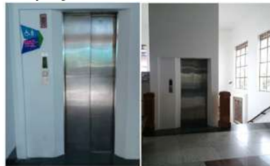
Gambar 4. Situasi lift

Lift merupakan alat mekanis elektrik yang berfungsi untuk membantu pergerakan vertikal di dalam bangunan. Lift juga dapat digunakan sebagai alternatif alat sirkulasi vertikal selain tangga bagi penyandang disabilitas. Ketentuan teknis lift berdasarkan Peraturan Menteri Pekerjaan Umum No.30/PRT/M/2006 dapat dilihat pada gambar 4.