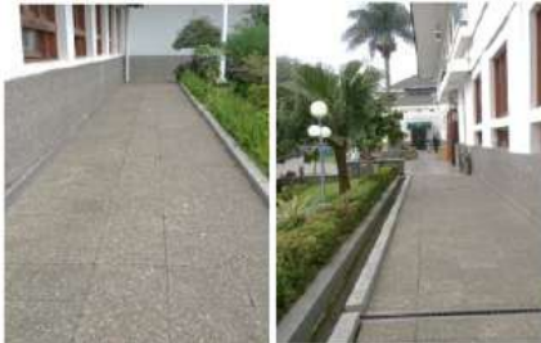
Gambar 5. Situasi koridor luar

Sirkulasi horizontal pada 28 seum ini terdiri dari koridor-koridor yang terdapat baik di luar bangunan maupun di dalam bangunan. Koridor di luar museum merupakan akses bagi pejalan kaki dalam mencapai museum. Sementara koridor di dalam museum berkaitan dengan besaran ruang yang disediakan untuk menikmati koleksi museum serta penghubung ruang pameran satu dengan ruang pameran lainnya.