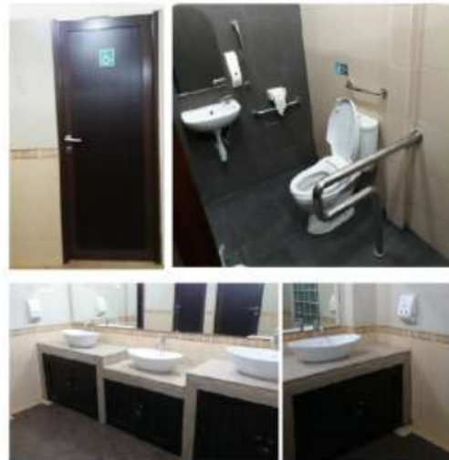
Gambar 7. Situasi toilet

4 Ketentuan teknis toilet berdasarkan Peraturan Menteri Pekerjaan Umum No.30/PRT/M/2006 dapat dilihat pada gambar 7.