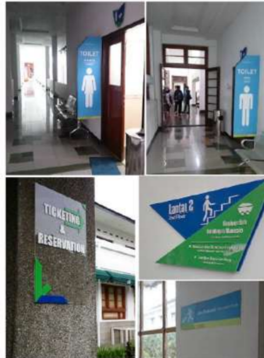
Gambar 10. Situasi marka

Signage atau rambu yang terdapat dalam bangunan museum ini antara lain adalah penunjuk toilet umum, penunjuk arah dan tujuan jalur pedestrian, serta penunjuk nama fasilitas dan tempat. Sementara itu untuk ruang pameran di lantai 1 terdapat penunjuk arah sirkulasi masuk dan keluar agar pengunjung bisa menikmati koleksi sesuai dengan urutan yang ditentukan museum.