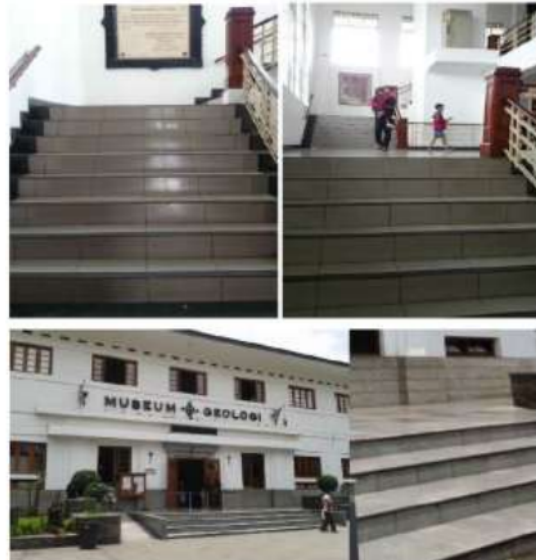
Gambar 3. Situasi tangga

Saat menaiki tangga, tangan bisa dengan mudah memegang handrail di samping, tetapi saat menuruni tangga, letak handrail lebih rendah dari yang seharusnya. Hal ini menyulitkan bagi orang-orang yang mengandalkan railing tangga untuk berpegangan saat akan menuruni tangga. Lebar tangga di dalam gedung ini juga tidak semuanya sama, meskipun kebanyakan anak tangga memiliki lebar 27 cm namun ada beberapa yang lebarnya kurang dari 27 cm. Meskipun begitu, tinggi pijakan sudah memenuhi standar yaitu 19 cm.