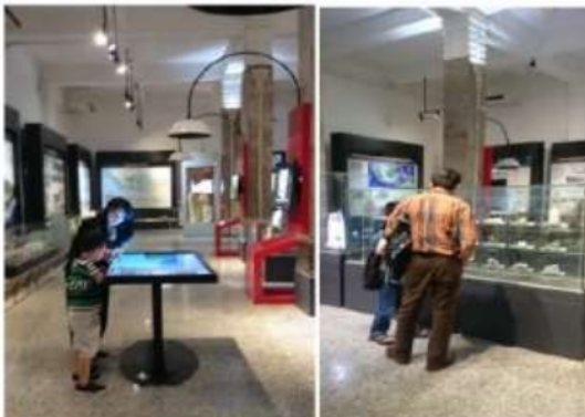
Gambar 9. Situasi perabot

Perabot yang dimaksud dalam penelitian ini adalah perabot-perabot yang digunakan dalam museum seperti vitrin, media audiovisual, meja counter tiket, dll. Ketentuan teknis perabot berdasarkan Peraturan Menteri Pekerjaan Umum No.30/PRT/M/2006 dan Smithsonian Guidelines for Accessible Exhibit Design dapat dilihat gambar 9.