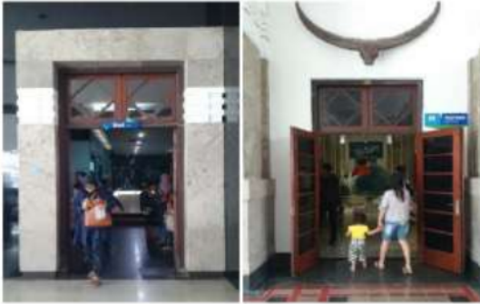
Gambar 8. Situasi pintu

Ketentuan teknis pintu berdasarkan Peraturan Menteri Pekerjaan Umum No.30/PRT/M/2006 dapat dilihat pada gambar 8.