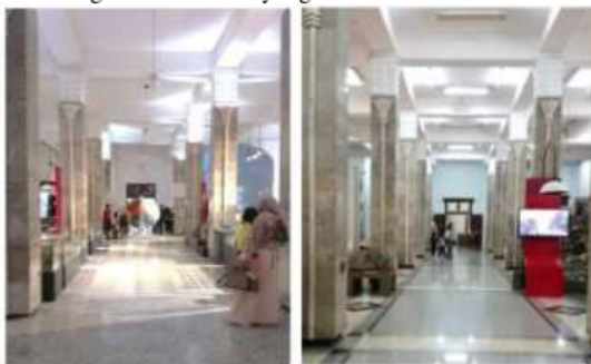
Gambar 6. Situasi koridor dalam

Situasi koridor di luar bangunan museum menggunakan material dengan tekstur yang tidak licin. Koridor dengan lebar 190 cm ini juga sudah memenuhi lebar minimal untuk jalur dua arah, yaitu sebesar 180 cm. Akan tetapi, grill drainase pada koridor tidak didesain tegak lurus dengan arah jalur. Hal ini bisa membahayakan pengguna jalan yang memakai kursi roda, ataupun anak-anak dengan ukuran kaki yang kecil.