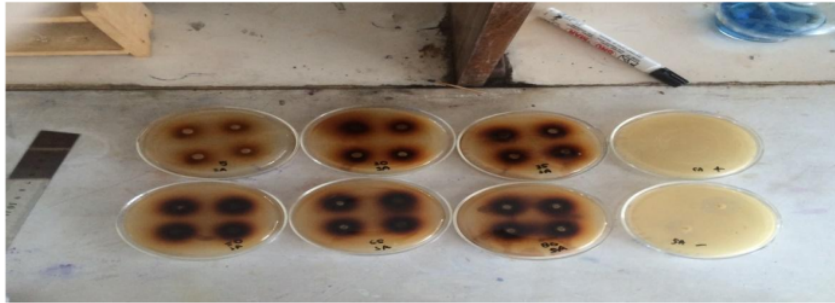
Gambar 1. Hasil Penelitian Metode Agar Well-Diffusion dengan Ekstrak CMC Daun Belimbing wuluh

Pada tabel 1 dapat dilihat bahwa dari perlakuan yang telah dilakukan tidak didapatkan zona hambat pada media.