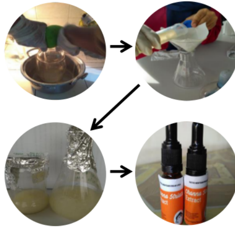
Gambar 1. Prosedur ekstraksi daging ikan gabus, a) pemerasan; b) filtrasi.; c) penyimpanan (preservasi); d) pengemasan

Penelitian diawali dengan pemrosesan daging ikan gabus yang diperoleh dari Rawa Pening, Jawa Tengah. Ikan gabus berjumlah 10 kg dibersihkan sisik dan isi perutnya, kemudian berat badan sampel ditimbang kembali dan dimasukkan ke dalam panci yang berisi air sehingga terendam sempurna. Pengukusan daging ikan gabus dilakukan pada suhu 70-80°C selama 30 menit (Sinambela, 2012). Daging ikan yang telah dikukus kemudian dibungkus dengan kain flanel dan dilakukan pemerasan. Hasil ekstrak ikan gabus kemudian disentrifugasi selama 60 menit pada kecepatan 6000 rpm. Tahapan pemrosesan daging ikan gabus dapat dilihat pada Gambar 1.