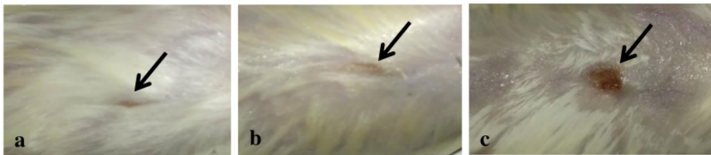
Gambar 3. Perbaikan jaringan kulit (tanda anak panah) pada hewan uji setelah perlakuan, a) perlakuan dengan ekstrak daging ikan gabus dosis 9 ml/kg bb; b) perlakuan dengan madecassol (kontrol positif); c) perlakuan tanpa ekstrak daging ikan gabus dan madecassol (kontrol negatif).

Keterangan : P0; kontrol negatif yaitu perlakuan tidak menggunakan ekstrak daging ikan gabus dan obat komersial madecassol ; P1; kontrol positif yaitu perlakuan dengan menggunakan obat komersial madecassol ; P2; perlakuan dengan menggunakan ekstrak daging ikan gabus dosis 9 ml/kg bb.