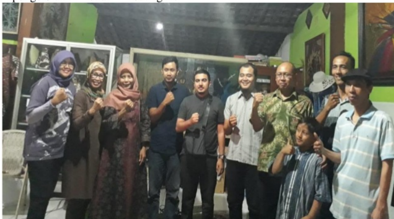
Gambar 1 Tim pengabdian bersama UKM mitra

Kegiatan pengabdian masyarakat ini diawali dengan pelatihan manajemen keuangan dengan menggunakan teknologi informasi. Sebelum dilaksanakan kegiatan pendampingan, sistem administrasi keuangan telah dilakukan dengan baik namun masih manual belum memanfaatkan teknologi informasi dengan komputer. Pelatihan yang dilakukan meliputi penggunaan fitur-fitur pada program microsoft excel untuk pencatatan dan penghitungan data keuangan UKM. Pengetahuan terhadap dasar-dasar pemrograman excel diperlukan karena pada rancangan sistem informasi manajemen batik yang akan dibuat pada tahapan berikutnya, hasil output yang diperoleh disimpan dalam data excel. Dokumentasi kegiatan pada tahap ini disajikan pada Gambar 1.