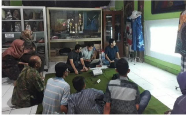
Gambar 4 Pelatihan penggunaan sistem informasi manajemen batik UKM Mutiara Hasta