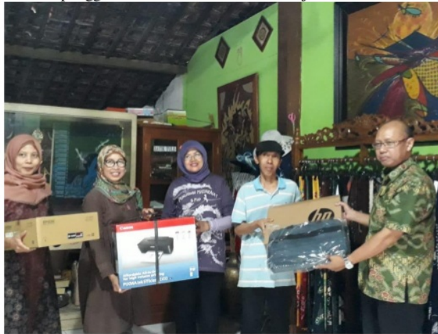
Gambar 5 Penyerahan seperangkat peralatan yang digunakan sebagai pendukung sistem informasi manajemen pada UKM Mutiara Hasta

Sistem informasi yang telah dikembangkan beserta seperangkat laptop, LCD dan printer untuk mencetak hasil laporan selanjutnya diserahkan kepada UKM mitra sebagai sumbangan dari tim pengabdian. Melalui kegiatan ini UKM Mutiara Hasta sebagai mitra pengabdian telah memiliki sistem informasi untuk perbaikan tatakelola administrasi dan keuangan UKM. Oleh karena itu hasil kegiatan pengabdian telah memberikan dampak yang positif bagi perkembangan UKM mitra.