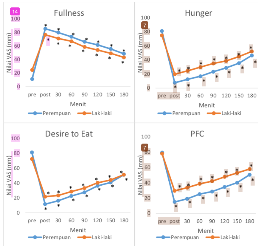
Gambar 1. Grafik perjalanan komponen satiety ( fullness, hunger, desire to eat, PFC ) dalam 3 jam pengukuran berdasarkan jenis kelamin