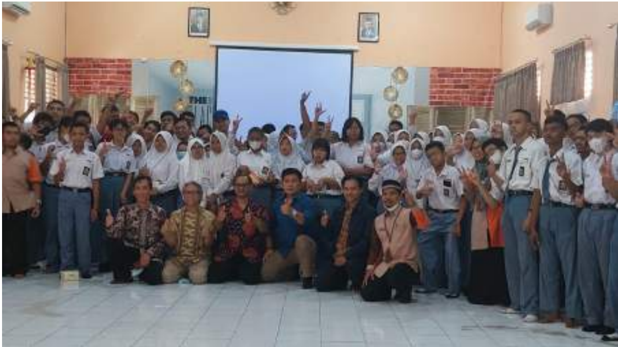
Berfoto bersama dengan para peserta SLB Negeri Kota Semarang