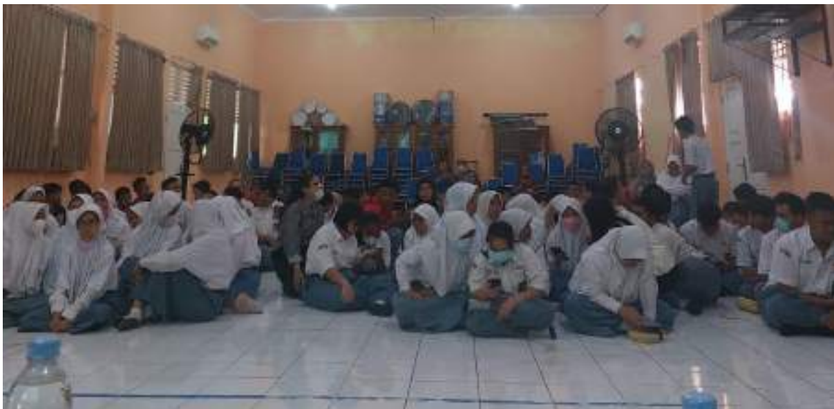
Para peserta yang sedang melakukan praktek penggunaan fitur-fitur yang ada di Instagram untuk mengunggah postingan.