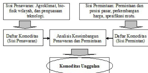
Ilustrasi 3. Pendekatan Penetapan Komoditas Unggulan

Pada sisi lain pembinaan pemahaman terhadap petani tentang penetapan komoditas unggulan juga perlu dilakukan secara intensif dan berkesinambungan. Kondisi ini di dasarkan pada realitas di lapang, bahwa pada umumnya ragam usaha pertanian sangat heterogen, sehingga tingkat efisiensi usahatani kurang dapat dihasilkan secara baik. Pengembangan komoditas unggulan yang berorientasi pada sumberdaya lokal dan pasar, diharapkan dapat meningkatkan efisiensi usahatani dan pada gilirannya tingkat keuntungannya menjadi lebih baik.