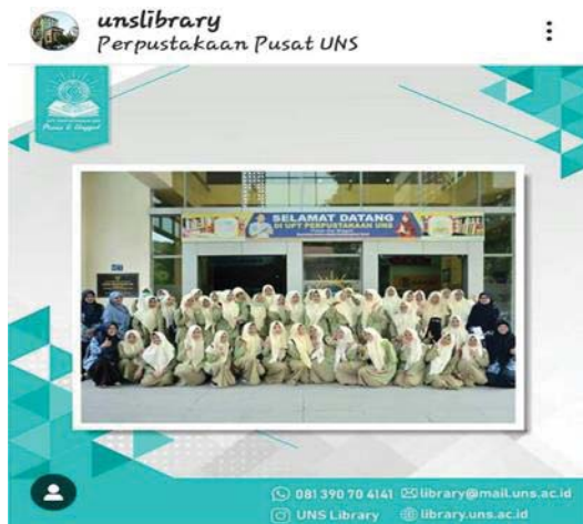
Gambar 3. Kegiatan Library Tour dengan Pelajar Sekolah (Sumber : UPT Perpustakaan UNS, 25 April 2019)

Gambar di atas adalah sebuah posting dari akun instagram @unslibrary yang mempublikasikan sebuah kegiatan library tour kepada pelajar SMA Islam Diponegoro Surakarta yang dilakukan pada Hari Kamis 25 April 2019 di UPT Perpustakaan UNS. Gambar 5.2 menunjukkan kegiatan mempromosikan perpustakaan dengan cara melakukan kerja sama dengan lembaga-lembaga dalam ruang lingkup Kota Surakarta telah berhasil membuat beberapa pelajar dari SMA Islam Diponegoro Surakarta yang mengunjungi UPT Perpustakaan UNS dan melakukan kegiatan pendidikan pemakai di UPT Perpustakaan UNS.