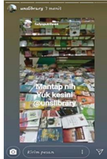
Gambar 2. Kegiatan Bazar Buku di UPT Perpustakaan UNS

Pada gambar di atas adalah salah satu bentuk publikasi kegiatan yang dilakukan oleh Humas UPT Perpustakaan UNS melalui media sosial instagram dengan nama akun @unslibrary, dalam publikasi kegiatan tersebut Humas UPT Perpustakaan menjelaskan bahwa kegiatan bazar buku tersebut dilakukan di lobi lantai 1 UPT Perpustakaan UNS yang terjadi pada hari Senin 25 Maret 2019.