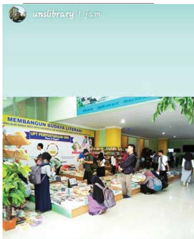
Gambar 1. Kegiatan Bazar Buku di UPT Perpustakaan UNS

Bentuk memberikan informasi kepada masyarakat yang dilakukan oleh divisi Humas UPT Perpustakaan UNS sebenarnya juga memiliki maksud dan tujuan lainnya, yaitu sebagai salah bentuk mempromosikan perpustakaan dan bentuk dari kegiatan pendidikan pemakai yang memberikan edukasi kepada masyarakat secara umum dan kepada seluruh civitas akademika UNS secara khusus.