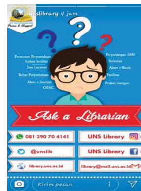
Gambar 4. Media Sosial Milik UPT Perpustakaan UNS

Humas UPT Perpustakaan UNS membuka layanan customer service kepada pengguna melalui media sosial yang dimiliki UPT Perpustakaan UNS. Hal tersebut dilakukan dengan tujuan untuk menampung dan menanggapi kebutuhan-kebutuhan kepada pengguna yang kemudian disampaikan kepada seluruh staf perpustakaan dan respon dari seluruh staf perpustakaan disampaikan kembali kepada pengguna.