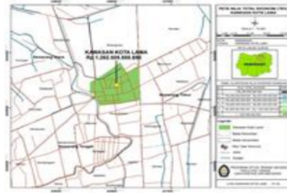
Gambar 1. Peta zona nilai ekonomi kawasan tempat wisata Kota Lama

penyedia jasa. Gambar 1 menunjukkan peta zona nilai ekonomi kawasan tempat wisata Kota Lama.