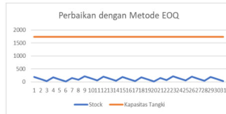
Gambar 2. Grafik Perbaikan Stock Super heavy Crude oil

Dari grafik tersebut sudah tidak terjadi penggunaan safety stock yang tersedia. Dari hasil MRP dengan jadwal dari perusahaan dapat dilakukan perhitungan untuk bulan Januari untuk mengetahui jadwal pemesanan yang harus dilakukan untuk menghindari penggunaan safety stock dengan metode EOQ dengan kesamaan lot size, lead time, dan demand setiap harinya. Maka didapatkan hasilnya pemesanan dilakukan pada tanggal 21, 24, 27, dan 30 Desember. Lalu tanggal 3, 5, 8, 11, 14, 17, 19 Januari. Dengan metode EOQ ini Total Cost yang dihasilkan sebesar $ 27.311.700.000. Dari hasil pemesanan pada tanggal tersebut menghasilkan ketersediaan terjaga tanpa menggunakan safety stock. Dapat terlihat pada gambar grafik berikut ini.