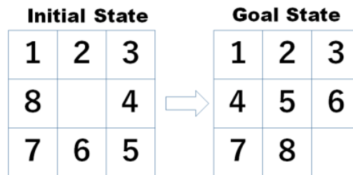
Gambar 1. Eight Puzzle

Untuk menyelesaikan persoalan permainan game puzzle ini ada beberapa metode yang dapat digunakan yaitu, A*, Greedy Best First Search, serta Hill Climbing. 5 Namun, penulis mengajukan solusi dengan metode yang berbeda yaitu dengan menggunakan algoritma genetika.