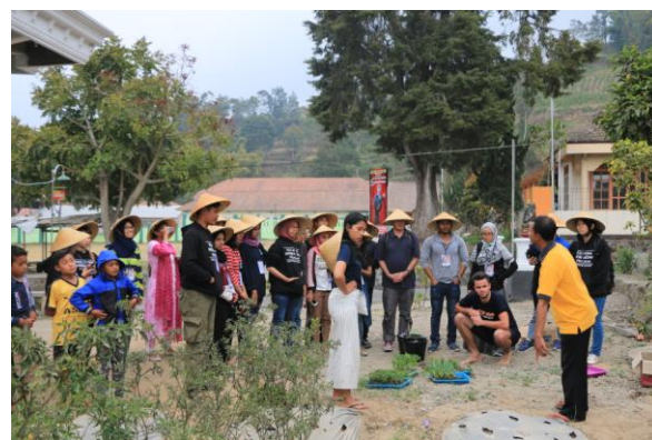
Gambar1 Kegiatan pelatihan penanaman tanaman sayur-mayur