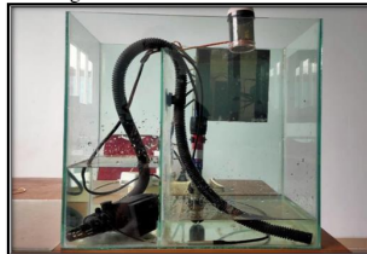
Gambar 4 Hasil Akhir Alat

Hasil pengembangan fish feeder and monitoring temperature control system menggunakan metode prototype berbasis internet of things pada akuarium ikan hias koki dengan kinerja produk sebagai berikut :