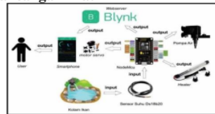
Gambar 3 Rancangan Alat

Berdasarkan Gambar 3 dijelaskan bahwa sensor suhu akan membaca (mengukur) suhu dalam akuarium Data yang sudah dibaca oleh sensor kemudian di proses oleh NodeMcu untuk dikirim ke webservice blynk.io. Data yang sudah diterima oleh blynk.io kemudian di proses menjadi grafik fluktuatif suhu akuarium.