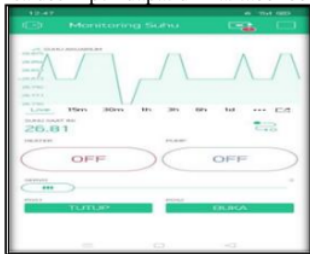
Gambar 5 Tampilan Menu pada aplikasi blynk di smartphone android

Uji produk ini menggunakan metode Dimension of Quality for Goods [5]. Hasil dari uji produk adalah nilai pengujian dari tim penguji yang terdiri dari 14 penguji yang berkompeten di bidang IT, yang kemudian hasil dari pengujian tersebut ditabulasikan dalam sebuah tabel yang dapat dilihat pada lembar lampiran dan file Uji Produk.sav. Hasil dari analisa deskriptif dapat dilihat tabel berikut.