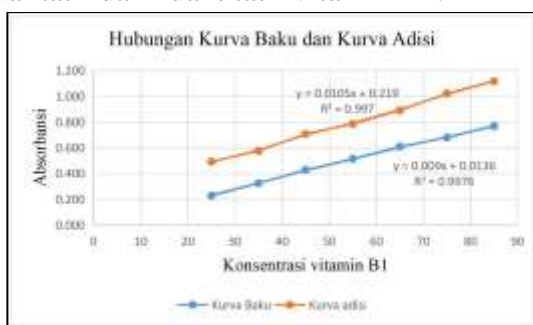
Gambar 3. Hubungan kurva baku standar vitamin B1 dengan kurva adisi

Metode dikatakan dapat mengeliminasi pengaruh matriks dengan baik apabila perbedaan slope antara kurva baku dan kurva adisi tidak berbeda secara signifikan. Hasil penelitian menunjukkan bahwa tidak ada perbedaan yang bermakna antara kurva baku standar dengan kurva baku adisi (Gambar 3). Dua variabel dikatakan berbeda signifikan jika nilai t -tabel < t -hitung (Nuryadi, 2017). Hasil yang diperoleh nilai t -tabel (2,57) > t -hitung (2,27), sehingga bisa disimpulkan bahwa perbedaan slope kurva baku dan kurva adisi tidak berbeda secara signifikan dan adanya matriks tempe tidak mempengaruhi prosedur analisis vitamin B1 menggunakan microplate reader . Hasil analisis statistik menunjukkan bahwa nilai t -hitung yang lebih rendah dari nilai t -tabel menegaskan bahwa penggunaan matriks tempe tidak mempengaruhi prosedur analisis, menguatkan kesimpulan bahwa metode ini dapat diandalkan untuk studi kualitatif dan kuantitatif vitamin B1.